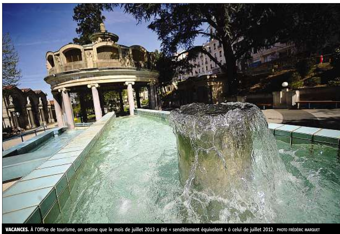
VACANCES. À l'Office de tourisme, on estime que le mois de juillet 2013 a été « sensiblement équivalent » à celui de juillet 2012.

Le camping Indigo a connu, quant à lui, un mois de juillet en demi-teinte. Si pendant la première quinzaine, le carnet de réservation n'affichait pas complet, à partir du 20 juillet, les fortes températures ont permis