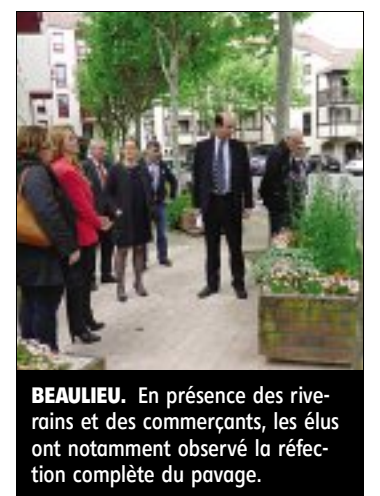
BEAULIEU. En présence des riverains et des commerçants, les élus ont notamment observé la réfection complète du pavage.

Ils se sont ensuite rendus place Beaulieu où à la demande des riverains et des commerçants, la municipalité a procédé à une réfection complète du pavage, l'installation de jardinières et la mise en place prochaine d'un banc. ■