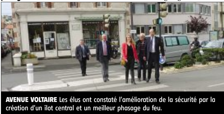
AVENUE VOLTAIRE Les élus ont constaté l'amélioration de la sécurité par la création d'un îlot central et un meilleur phasage du feu.