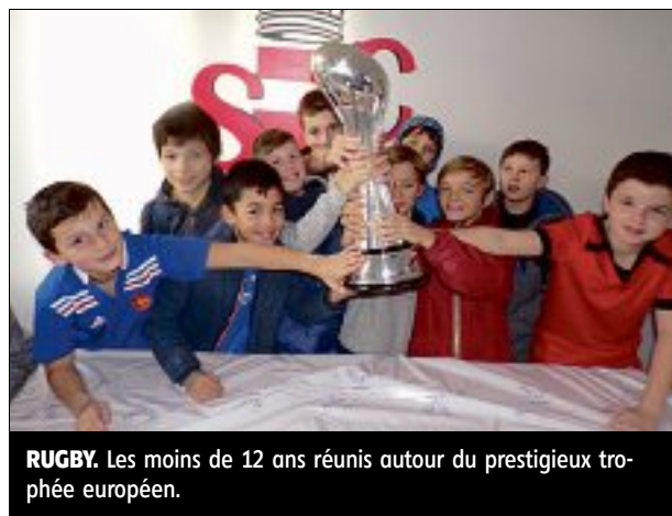
RUGBY. Les moins de 12 ans réunis autour du prestigieux trophée européen.

Le Stade chamaliérois a accueilli mercredi, dans son nouveau club house, la challenge Cup, brillamment remportée par l'ASM Clermont Auvergne la saison dernière,