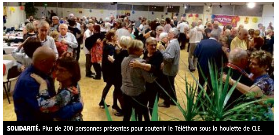
SOLIDARITÉ. Plus de 200 personnes présentes pour soutenir le Téléthon sous la houlette de CLE.

« Ce chiffre n'est peut-être pas définitif car j'ai mis une urne à la disposition des adhérents dans