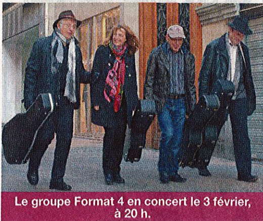
Le groupe Format 4 en concert le 3 février, à 20 h.

Du 2 février au 17 mars : exposition à la Galerie Municipale d'exposition de « Paul Sarrassat » : « Volumes, lignes et figures »