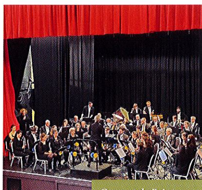
Concert de Printemps.

Vous avez jusqu'au 4 juin pour venir découvrir à la Galerie Municipale d'Art Contemporain la sublime exposition de l'artiste peintre France Lascurain Tautou . Artiste, peintre, passionnée de recherches picturales, France a construit son chemin artistique dans l'abstraction, qui s'est révélé être le mode d'expression qui convenait le mieux à sa liberté et à sa démarche créatrice. Influencée par Goya et Rembrandt, elle est assurément une peintre de la lumière et des contrastes, jouant entre les tonalités pour obtenir l'harmonie parfaite, celle qui transporte les cœurs et les passions. Tourbillonnantes et virevoltantes ses œuvres vivent du regard qu'on leur porte. Ce sont des espaces de liberté et d'échanges qui incitent à l'intériorisation. Ses dernières créations, où sentiments et émotions sont subtilement déposés sur ses toiles, donnent à voir la lumière. Des paysages intérieurs qui s'électrisent, protestent parfois et apaisent bien souvent. Aucun élément figuratif ne dirige ou cloisonne bien au contraire, c'est une liberté totale qui se retrouve dans le mouvement et dans le geste. Car pour elle, la peinture est bien plus qu'un art de vivre c'est une nécessité !