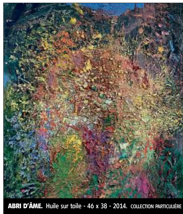
ABRI D'ÂME. Huile sur toile - 46 x 38 - 2014. COLLECTION PARTICULIÈRE